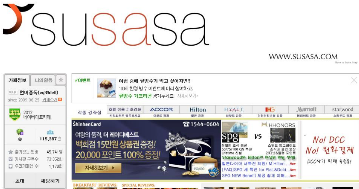
▲여행 정보 카페 스사사 캡처